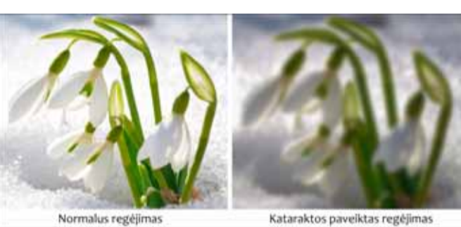
Normalus regėjimas Kataraktos paveiktas regėjimas

Pastebėjote silpstantį regėjimą, nebežiūrite daiktų kontūrų, vaizdai tapo išplaukę, matomi tarsi pro rūkā – reiktų nedelsiant pasikonsultuoti su gydytoju. Visi šie požymiai būdingi vienai pagrindinių regėjimo netekimo priežasčių pasaulyje – kataraktai. Kas tai per liga, kokios susirgimo priežastys, kaip gydytis?